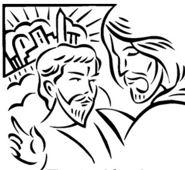
Tentación de Jesús

Copyright © Sermons4Kids, Inc. Todos los derechos reservados