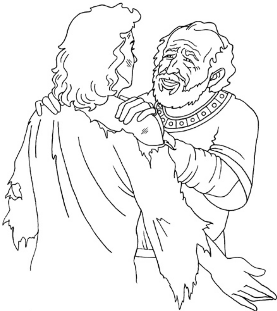
Parábola del hijo perdido Lucas 15:11-32

Copyright © Calvary Chapel Todos los derechos reservados Usado con permiso