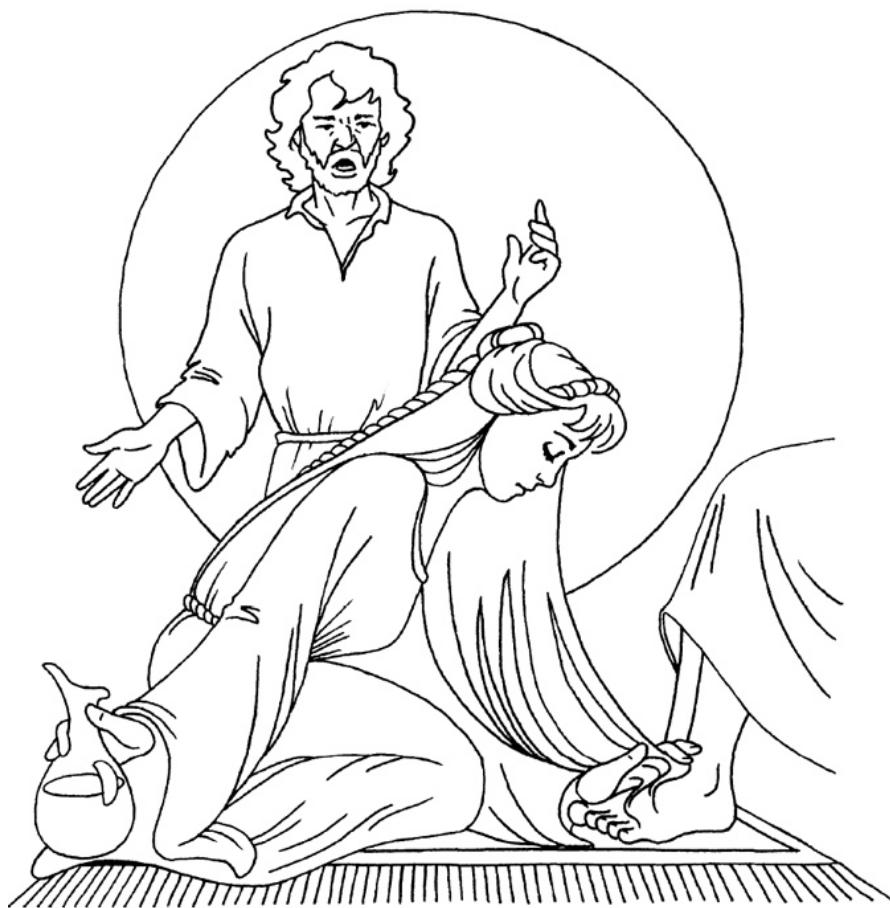
María unge a Jesús Juan 12:1-8