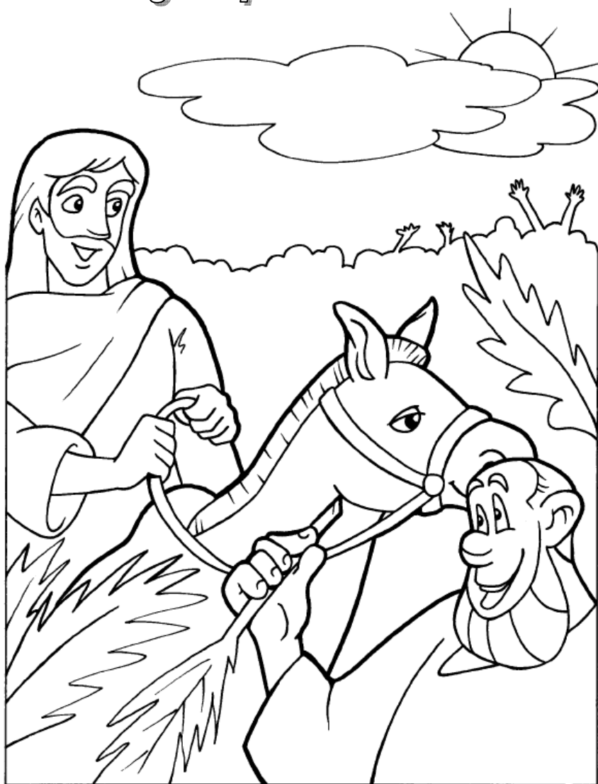
La entrada de Jesús a Jerusalén