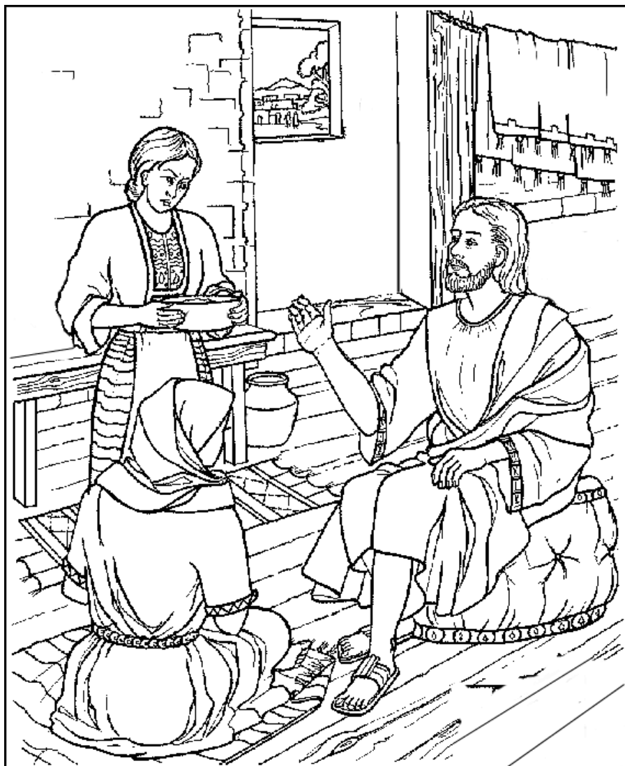
En casa de María y Marta

Copyright © ABDA ACTS Art & Publishing Used by Permission