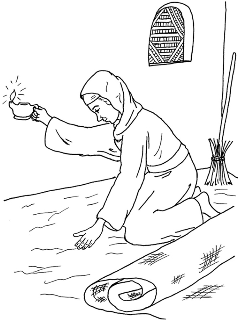
Parábola de la moneda perdida Lucas 15:8-10