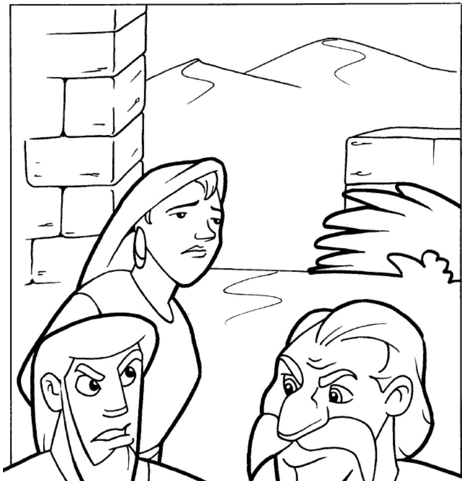
La mujer adúltera Juan 8: 1-11

Copyright © CalvaryCurriculum.com Todos los derechos reservados Usado con permiso